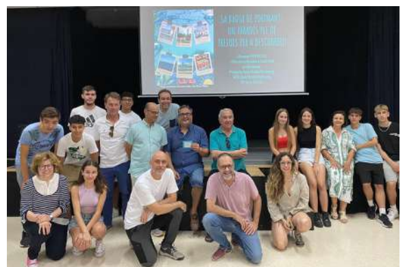
Els alumnes de Quartó de Portmany presenten 'Un paradís ple de tresors