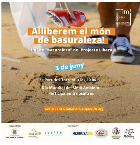
neteja a Port des Torrent per celebrar el Dia del Medi Ambient.