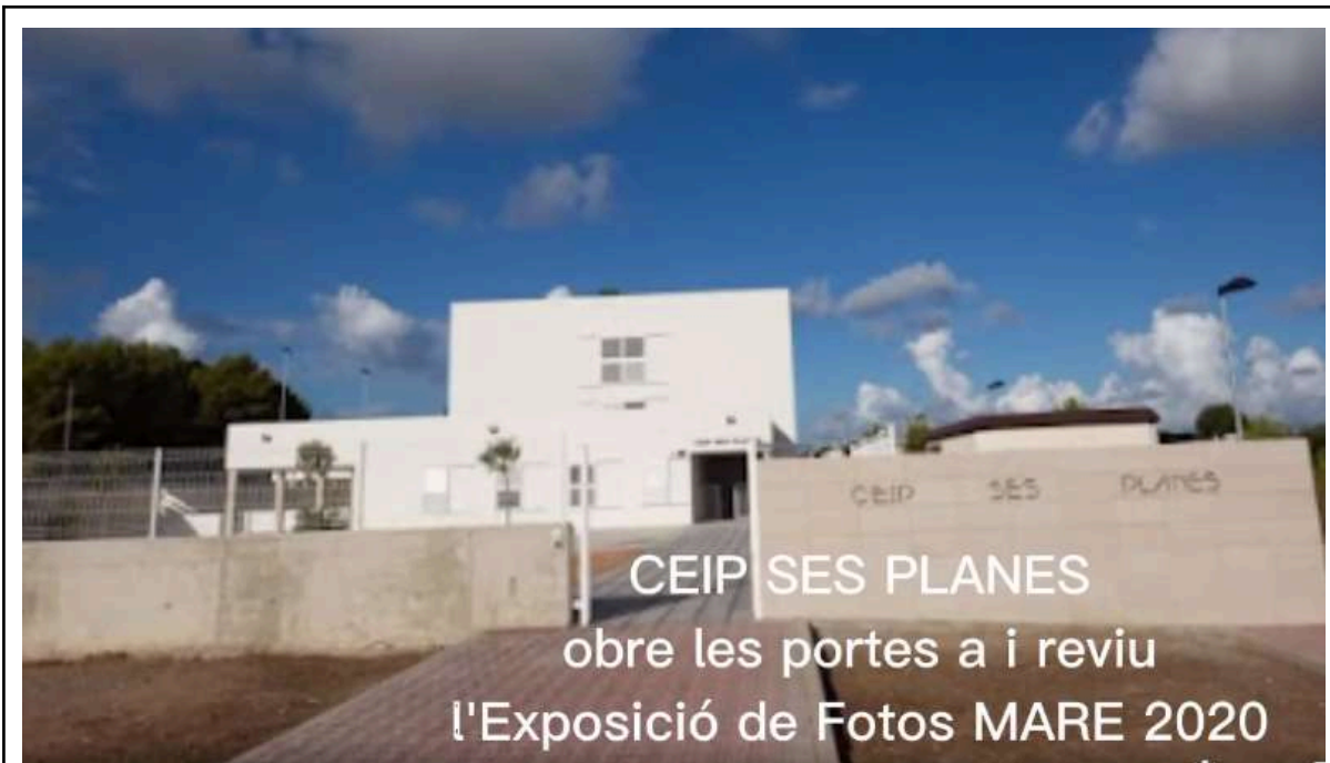
Expo de Mare en el ceip ses Planes