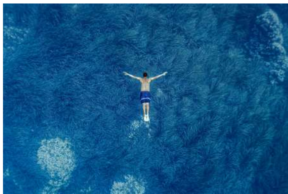
SSBP ens adherim al Pacte blau